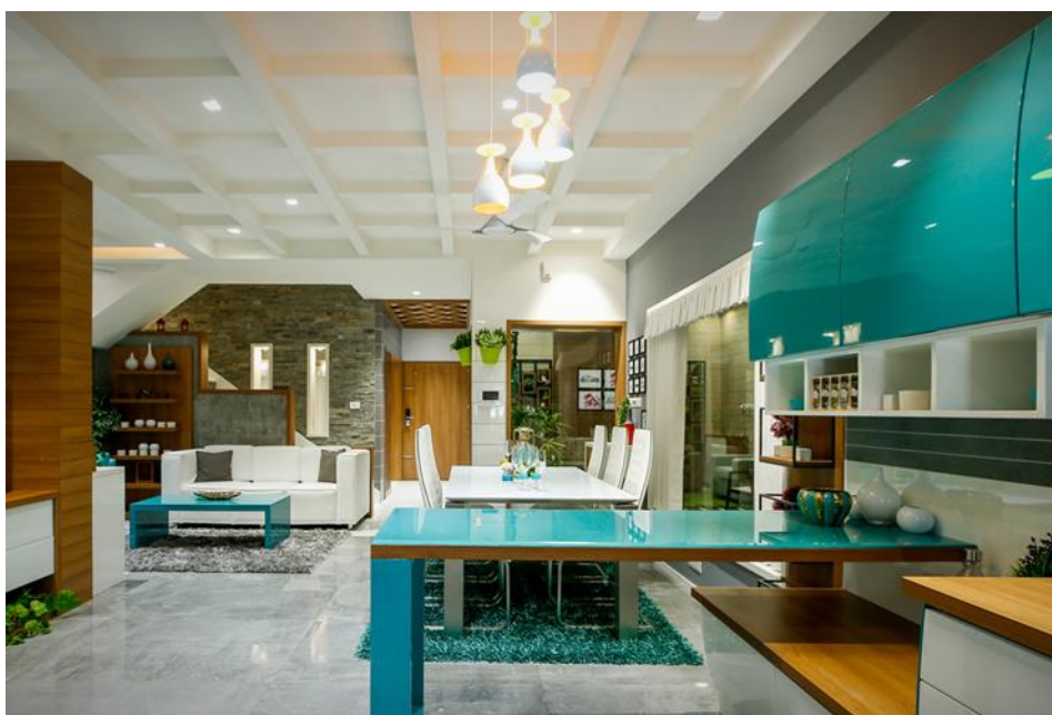
Fig.1.6. Concepția design-ului interior „Office-Total”.