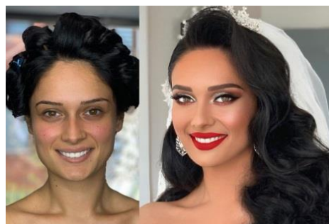
Foto 2.8. Rezultatul obținut al machiajului corector [elaborat de autor]